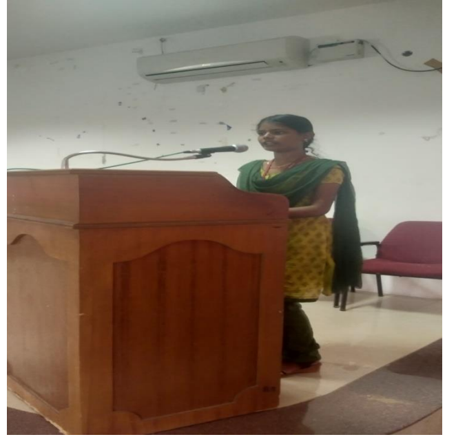
மாணவர்கள் நூல் மதிப்புரை செய்தல்