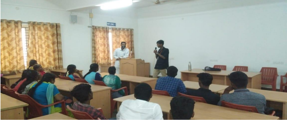
மூன்றாமாண்டு மாணவர் வினா கேட்டல்