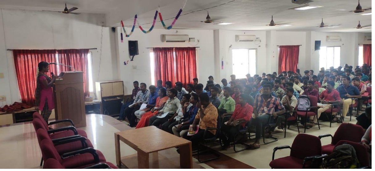
இளங்கலைத் தமிழ் மூன்றாமாண்டு மாணவி வினாவுதல்

13.09.2019 செவ்வாய்க்கிழமை அன்று 67-ஆவது வாசகர் வட்டம், நேரம் காலை 11:50 – 01:30 மணி வரை புத்தக மதிப்புரை நடைபெற்றது. புத்தக மதிப்புரை செய்த மாணவர்கள்