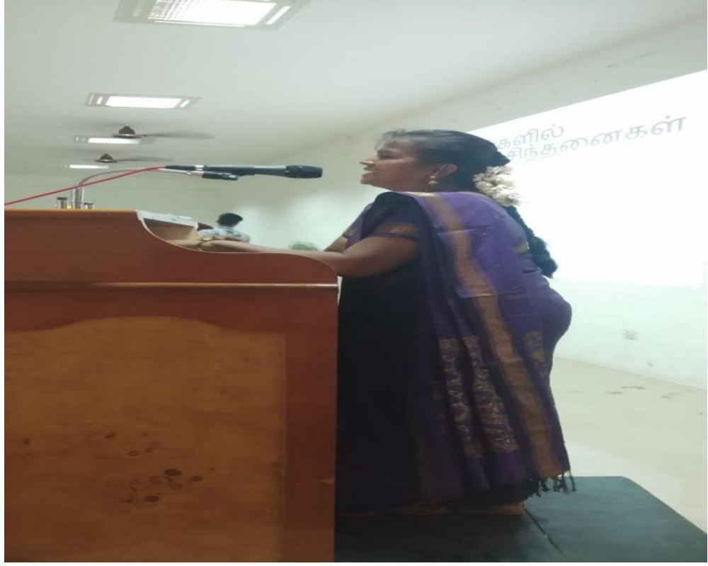
சிறப்பு விருந்தினர் சொற்பொழிவாற்றுதல்