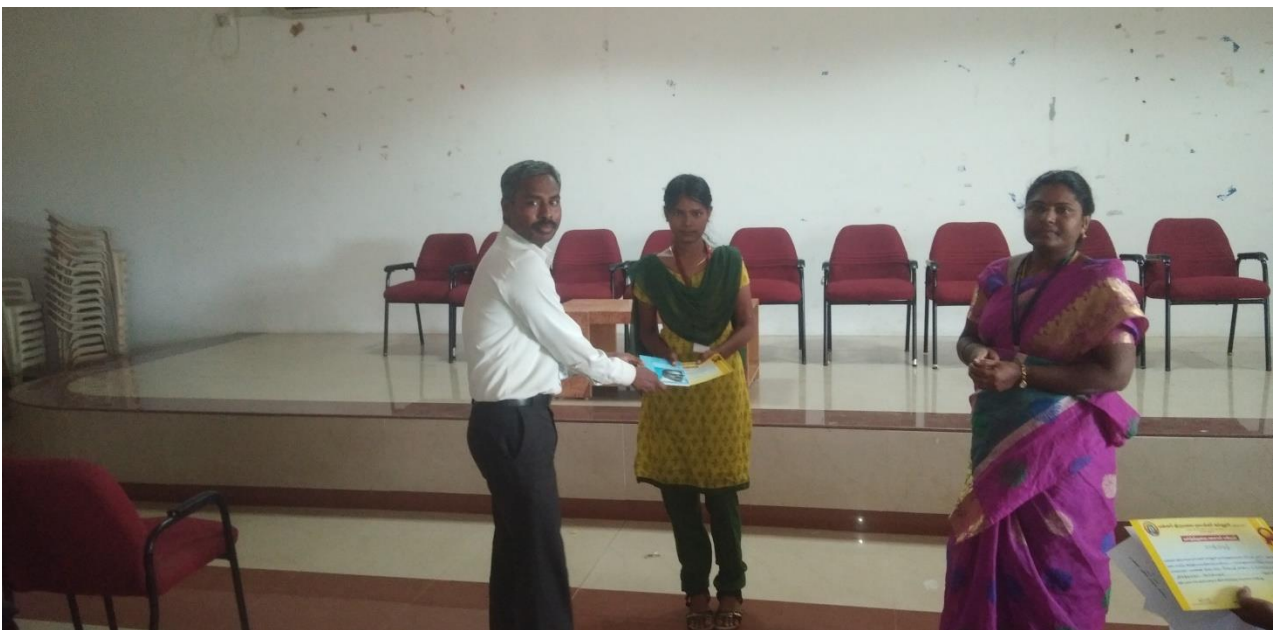
நூல் மதிப்புரை செய்த மாணவிக்கு சான்றிதழ் மற்றும் பரிசு வழங்குதல்