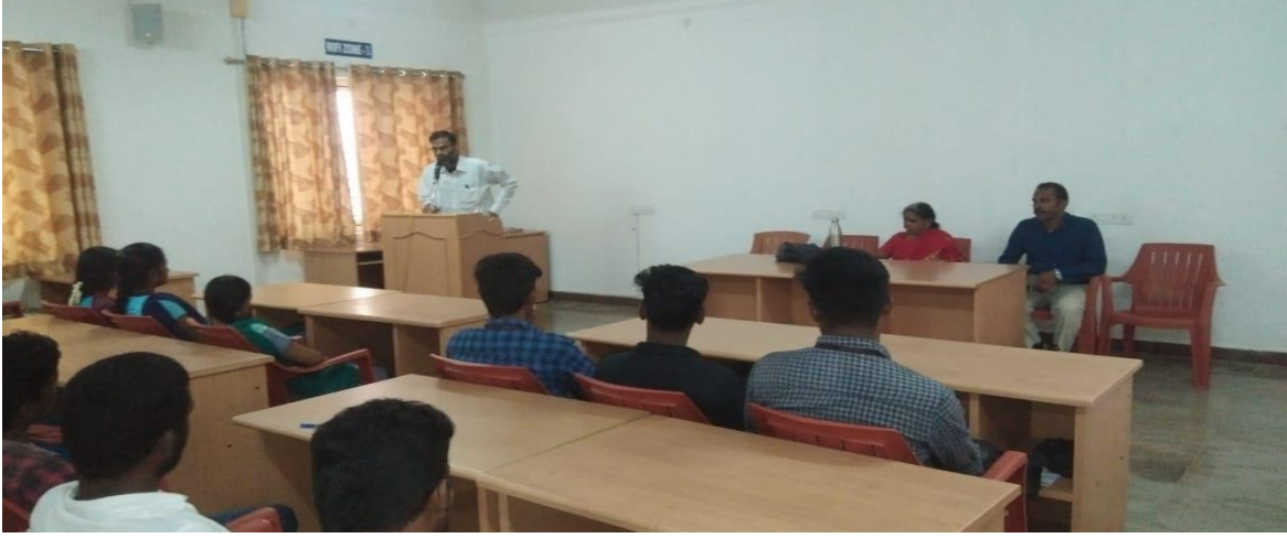
சிறப்பு விருந்தினர் முனைவர் ரமேஸ் பக்தவச்சலு சிறப்புரையாற்றினார்.

ஐந்திணைத் தமிழ் மன்றம் நடத்தும் சிறப்பு சொற்பொழிவு (நாள்- 22.10.2019 வியாழன்) சிறப்பு விருந்தினர் - முனைவர் ரமேஸ் பக்தவச்சலு தலைப்பு - இந்தியப் பண்பாடு